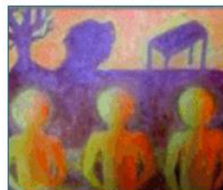
Mito da Caverna: uma das principais alegorias da história da Filosofia

O Mito da Caverna, também conhecido como “Alegoria da Caverna” é uma passagem do livro “A República” do filósofo grego Platão. É mais uma alegoria do que propriamente um mito. É considerada uma das mais importantes alegorias da história da Filosofia. Através desta metáfora é possível conhecer uma importante teoria platônica: como, através do conhecimento, é possível captar a existência do mundo sensível (conhecido através dos sentidos) e do mundo inteligível (conhecido somente através da razão).”